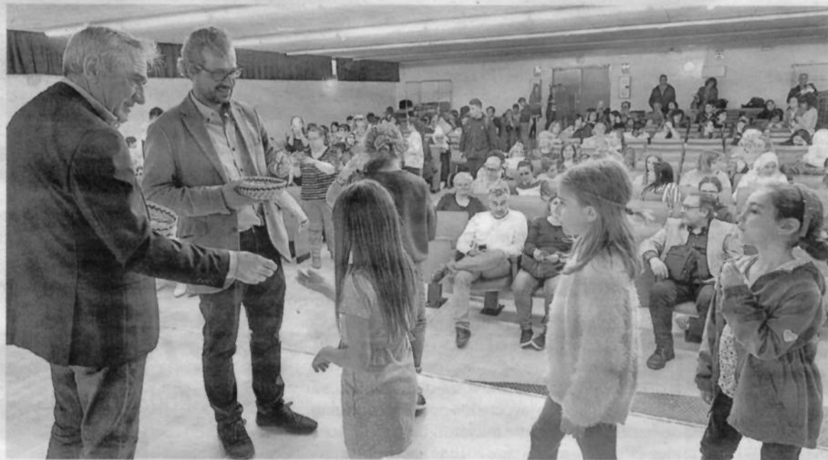
Un momento del acto en el que se reconoció el interés por el hábito lector.

tricolados en Abat Marçet, Agustí Bartra, Cultura Pràctica, Font de l'Alba, Francesc Aldea, Joan Marquès Casals, Marià Galí, Martí, Ponent, Ramon Pont, Roc Alabern Sala i Badrinas, Sant Llorenç y Vallès. La iniciativa de la fundación tiene la implicación del Ayuntamiento y Generalitat. ▶