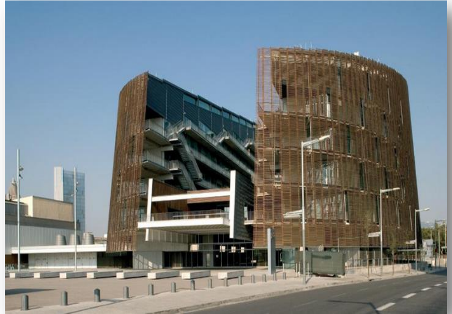
Parc de Recerca Biomèdica de Barcelona, PRBB

Donem als nostres alumnes recursos i oportunitats a l'alçada dels reptes de la societat del segle XXI.