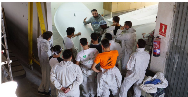
Fotografia Institut de Nàutica de Barcelona

Vine ara, t'hi esperem: Aventura't en la Formació Professional