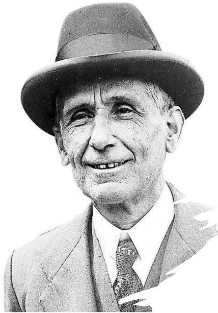
Pompeu Fabra i Poch (1868-1948)