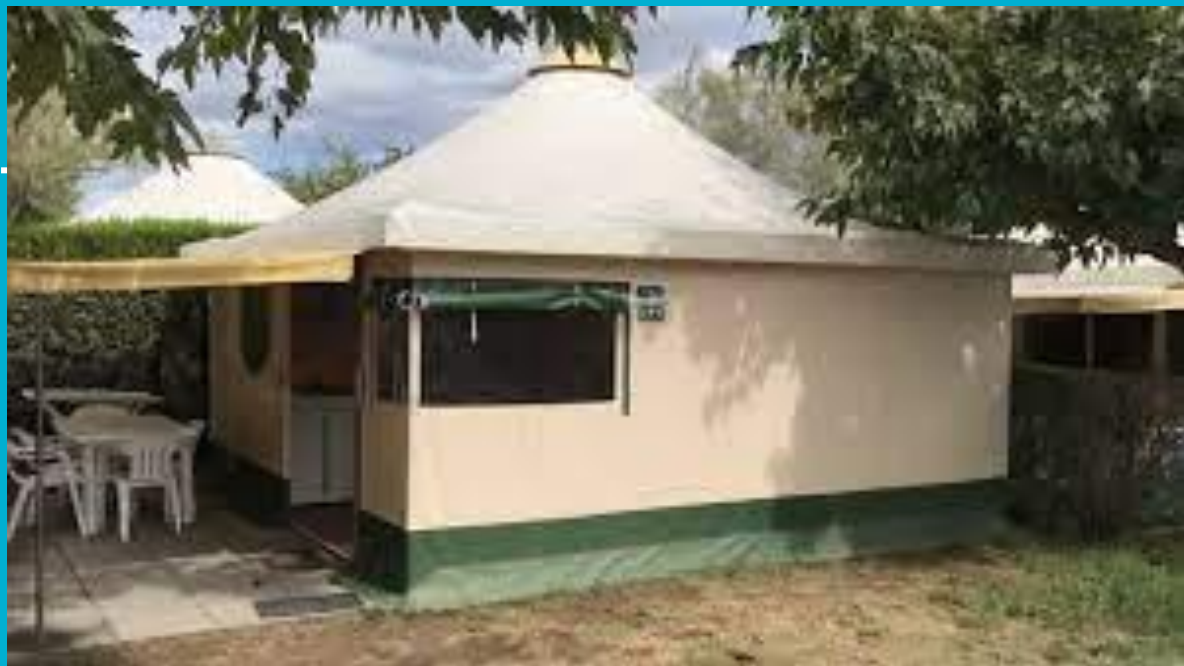
VIDEO - TENDA NATURE