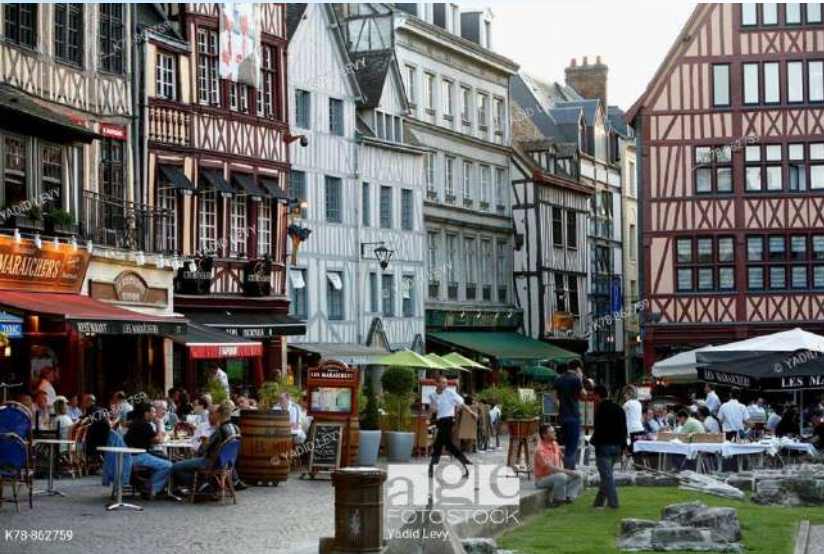
Place du vieux marché