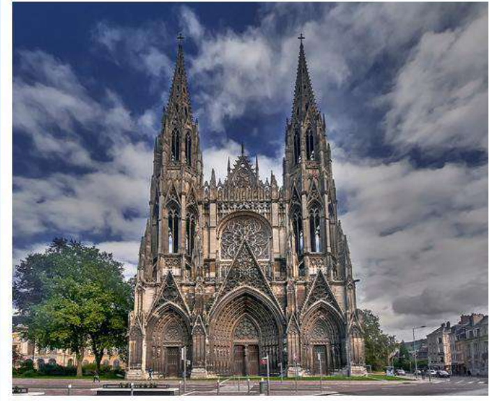
Cathédrale de Rouen