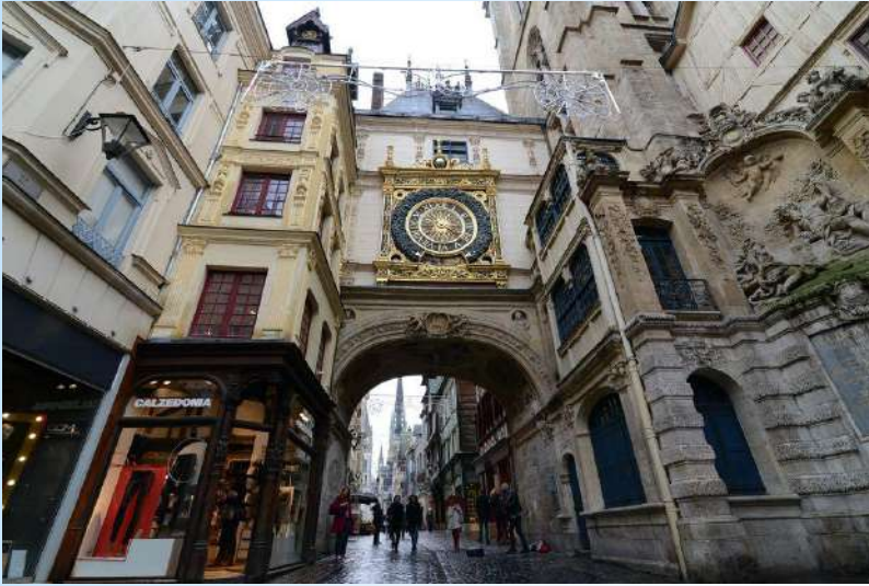
Rue du gros horloge