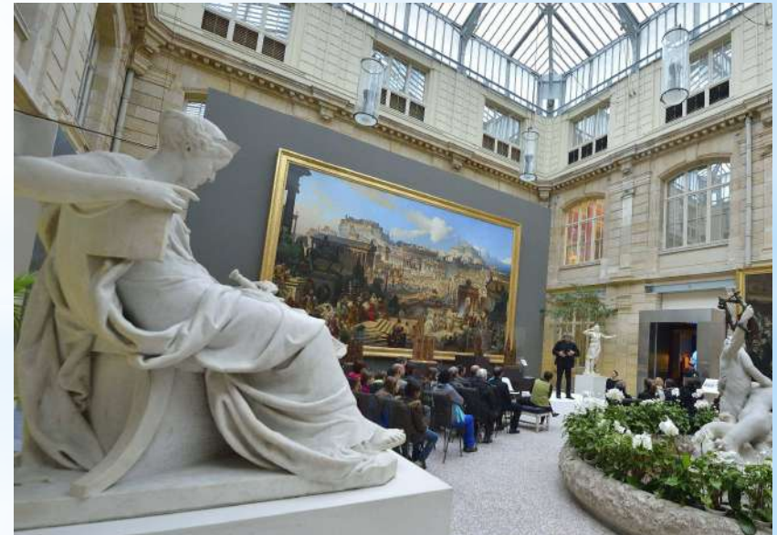
Musée de beaux arts