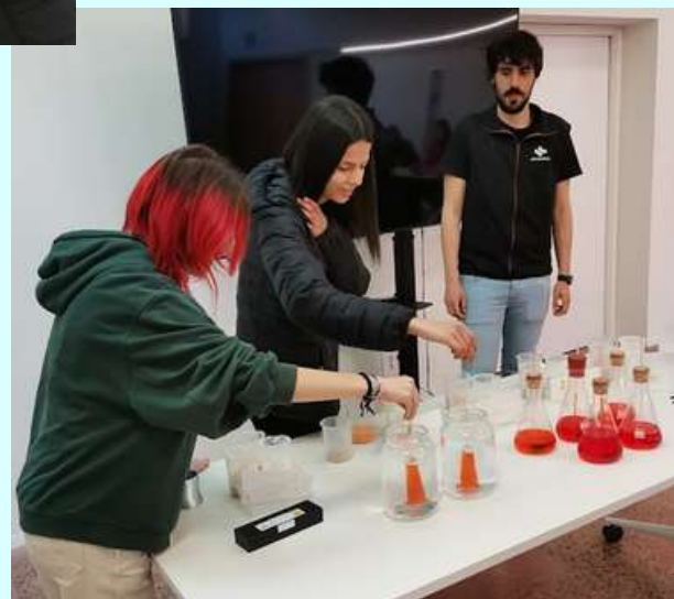
Alumnat durant el taller i al volcà Montsacopa.

Després de participar en el taller i visitar l'exposició, l'alumnat va fer una petita excursió al volcà Montsacopa.