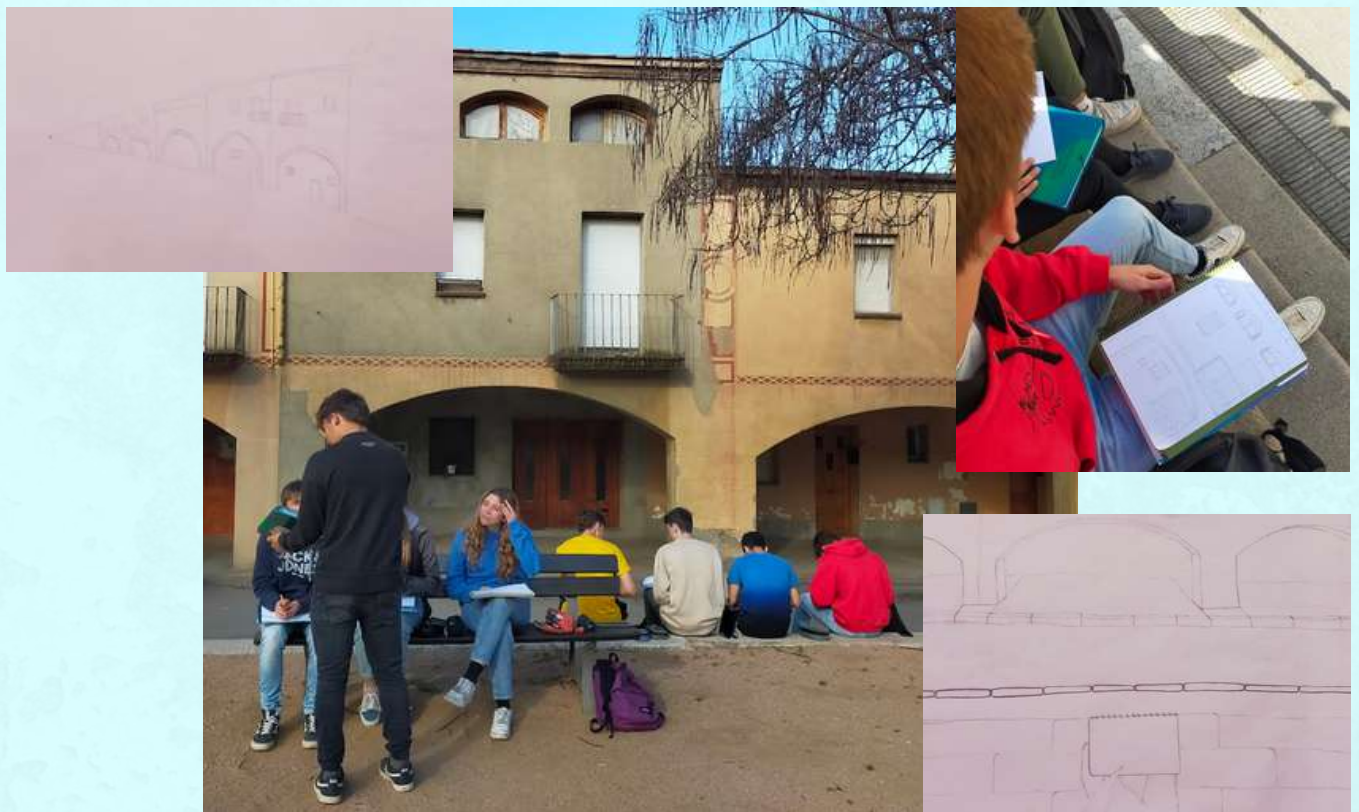
Alumnat realitzant l'activitat pels voltants del centre i alguns dels esbossos resultants

L'alumnat de 1r i 2n de batxillerat de la matèria de Dibuix Tècnic va realitzar l'activitat d'il·lustració de perspectiva cònica i entorn, relacionada amb la jornada STEAM que vam realitzar al nostre centre el passat divendres 31 de març.