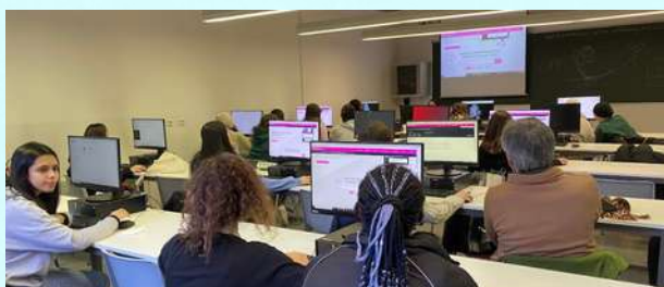
Alumnat de 1r de batx en una aula de la UVIC.

L'alumnat de Biologia i Biomedicina de 1r de batxillerat va realitzar una sortida a la UVIC, en què es va introduir en l'anàlisi computacional de proteïnes i els seu impacte en el disseny de fàrmacs.