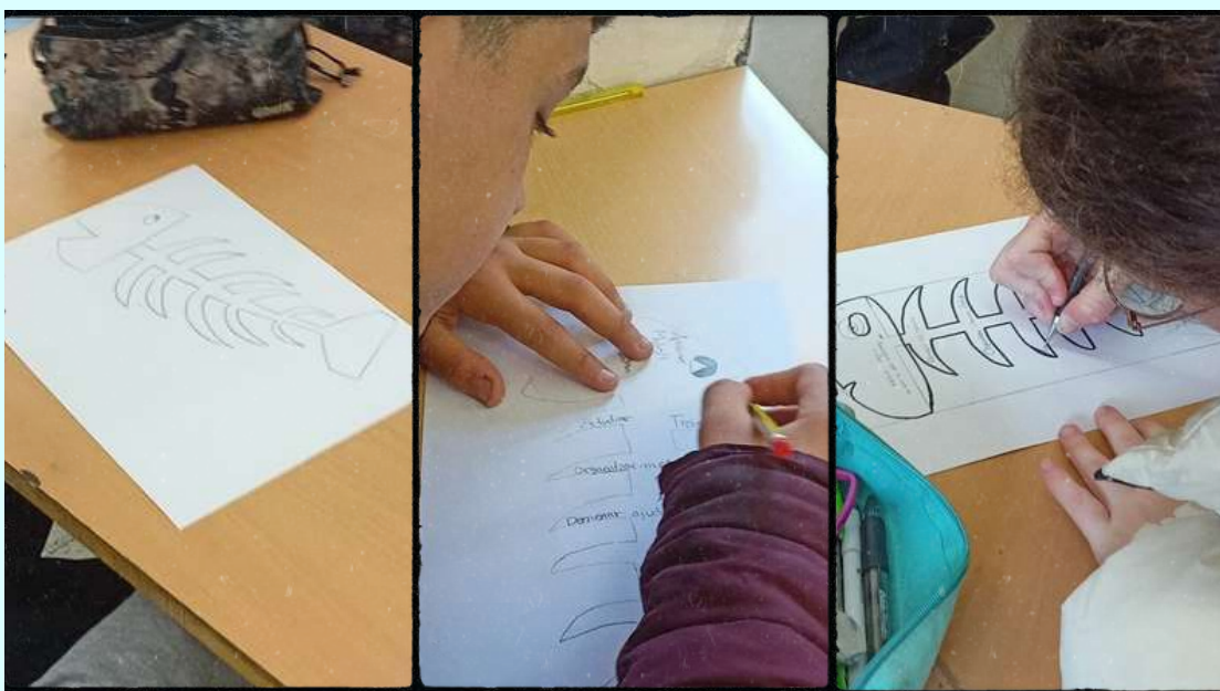
Esquema de l'espina de peix i un parell d'exemples d'alumnat de 3r d'ESO.

L'alumnat de 3r d'ESO està molt pendent dels progressos que realitzen dia a dia. Els diferents grups ha desglossat de manera unipersonal els objectius que han de treballar, a partir de l'esquema d'una espina de peix. D'aquesta manera es plantegen passos concrets i realistes que els ajudaran a gestionar millor l'assoliment de les metes individuals.