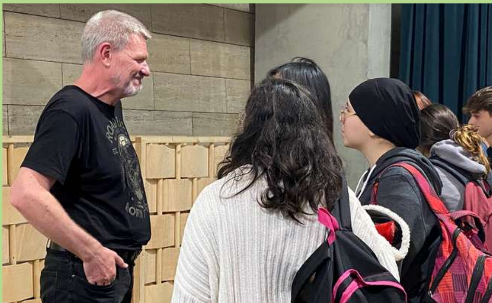
Un grup d'alumnes de l'INS Antoni Pous intercanviant unes paraules amb el conferenciant, David Bueno.

Agraïm al CCCB aquesta iniciativa i esperem continuar oferint experiències que apropin l'alumnat a la ciència.