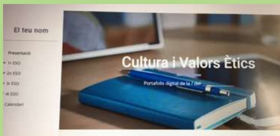
Imatge d'un portafolis digitals d'exemple.

Aquestes jornades són una oportunitat per compartir bones pràctiques entre centres i ampliar la mirada. A través de diverses taules de bones pràctiques educatives i de gestió, es posen en comú experiències educatives entre professionals de l'educació.