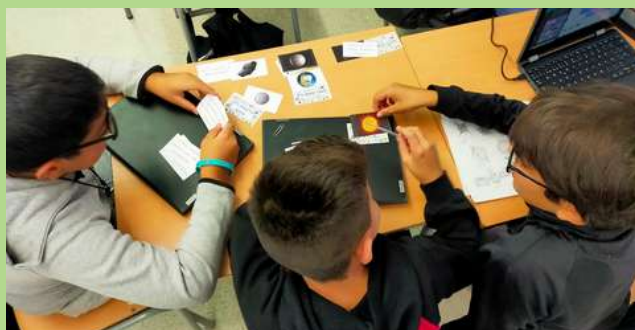
Alumnes de 1r d'ESO durant el procés de cerca.

L'alumnat està investigant les característiques dels planetes del sistema solar, així com les respectives distàncies amb el Sol. A través d'un joc s'han establert relacions i s'ha construït una maqueta on hem aplicat els factors de conversió.