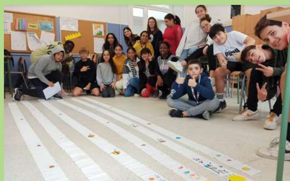
Un dels grups d'alumnat de 1r d'ESO mostra un dels jocs d'aprenentatge.

A l'espai globalitzat de STEAM de 1r d'ESO s'està treballant en un projecte d'Astronomia.