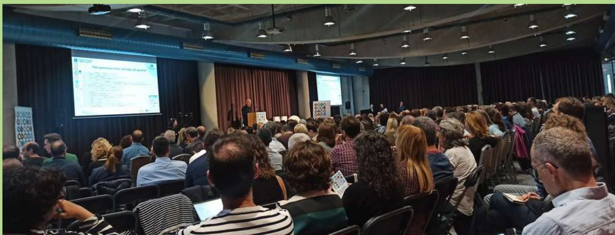
La Jornada presencial es va dur a terme a l'Hotel Exe Campus de Bellaterra.

Un any més, des de l'INS Antoni Pous i Argila hem participat a les XX Jornades de Qualitat a l'Ensenyament. L'INS està vinculat al projecte de Qualitat i Millora Contínua des del 2010, el qual ens ha permès anar avançant com a centre i treballar per la millora contínua en totes les seves àrees.