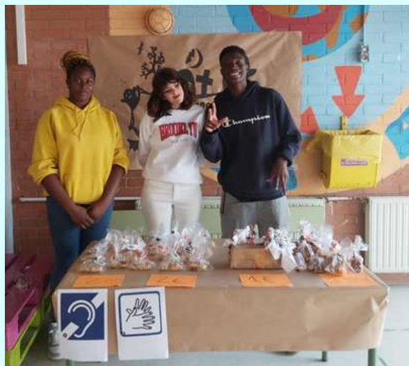
Els símbols que hi ha al davant de la parada anuncien un punt d'accessibilitat.

L'alumnat ha treballat els punts d'accessibilitat per a persones amb dificultats d'audició. En aquests punts, que se senyalitzen amb els símbols que es mostren en la fotografia, es parla llenguatge de signes .