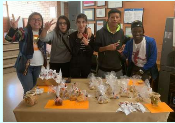
Alumnat d'IFE-AMIE en els diferents punts de venda de l'institut.

L'alumnat de l'IFE-AMIE ha venut panellets, pastissos, porta espelmes i piruletes fantasmes a l'institut, durant tres dies seguits, per tal de recollir diners per a la sortida de final de curs.