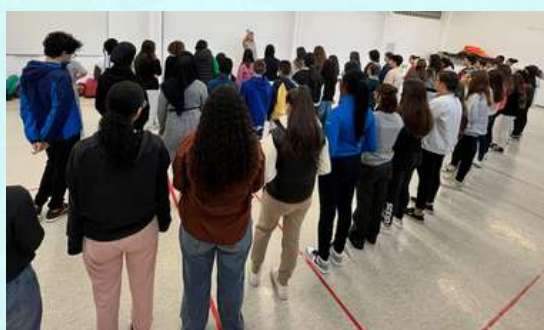
Primers assajos del cor Khoreia al gimnàs.

Seguint amb el fil musical, aquesta setmana hem començat els assajos amb el cor Khoreia, que ha engegat amb una alta participació: més de 120 alumnes s'ha inscrit en el projecte!!