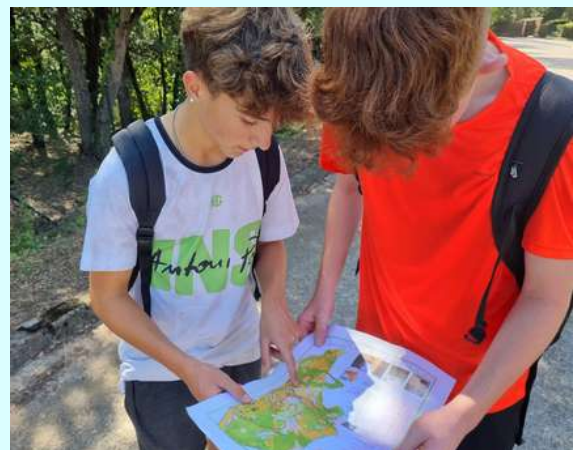
Cursa d'orientació de Sant Martí de Centelles.

D'altra banda, dilluns passat, l'alumnat de 1r de GMNTLL va realitzar la cursa d'orientació de Sant Martí de Centelles dins l'MP 5 Guia de baixa i mitjana muntanya.