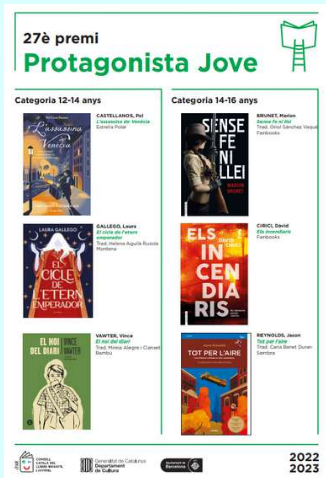
Els llibres finalistes del Premi Protagonista Jove 2023.

D'altra banda, el centre incentiva el gust per la lectura des de diferents espais i propostes: 30 minuts diaris de la lectura silenciosa i individual a l'aula, el servei de préstec d'una oferta àmplia de llibres de literatura juvenil, la dinamització d'activitats "Serpent de llibres", la participació al Certamen de lectura en veu alta, entre d'altres, així com la participació en la dinamització lectora .