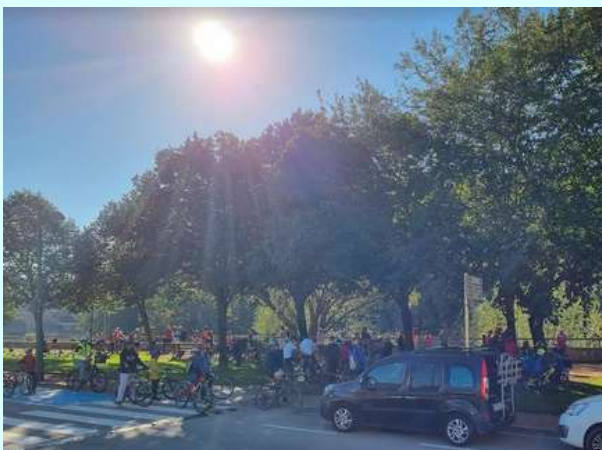
Pedalada per a la sostenibilitat.

El diumenge 2 d'octubre van formar part de l'organització de la pedalada per a la sostenibilitat. Durant la jornada, hi van haver activitats d'escalfament i dinàmiques per a millorar la tècnica de la btt a partir del joc. Hi van participar 110 persones!