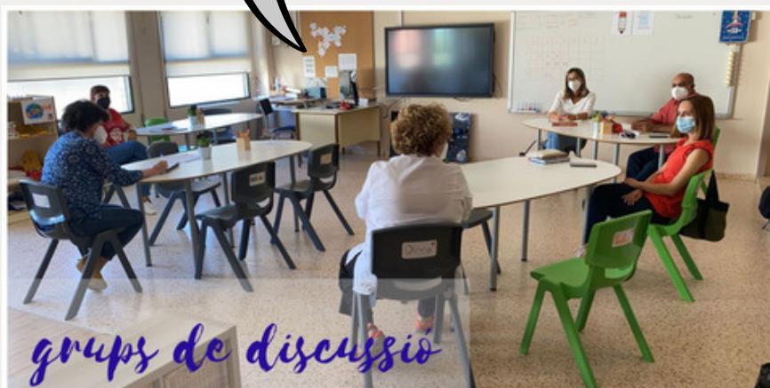
grups de discussió

Seguir repensant i autoquestionant-nos per la millora continua del nostre centre!