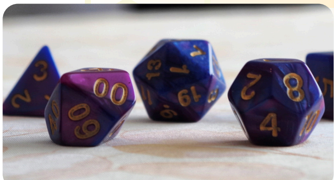
Títol: Sort platònica Autor: Jofre Reche (1r cicle ESO)