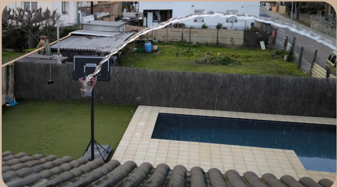
Títol: Paràbola del triple Autor: Júlia Guiolà (2n cicle ESO)

Per més exemples de fotografies matemàtiques consulta la web d'ABEAM: https://fotografiamatematica.cat/