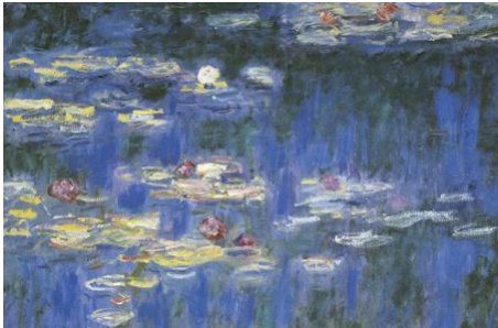
C → Claude Monet. Els nenúfars