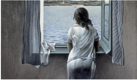
A → Salvador Dalí: Noia a l'ampit d'una finestra