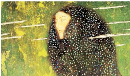
E → Gustav Klimt. Nimfes d'aigua