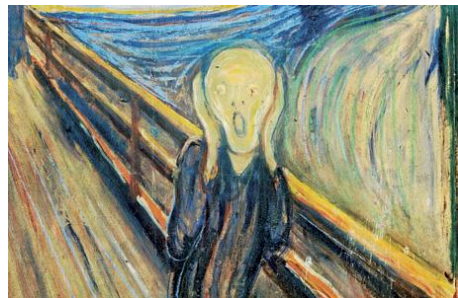
D → Edvard Munch. El crit (detall)