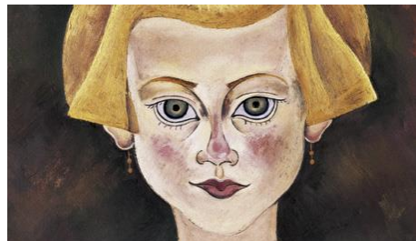
F → Joan Miró. Retrat d'una vailleta