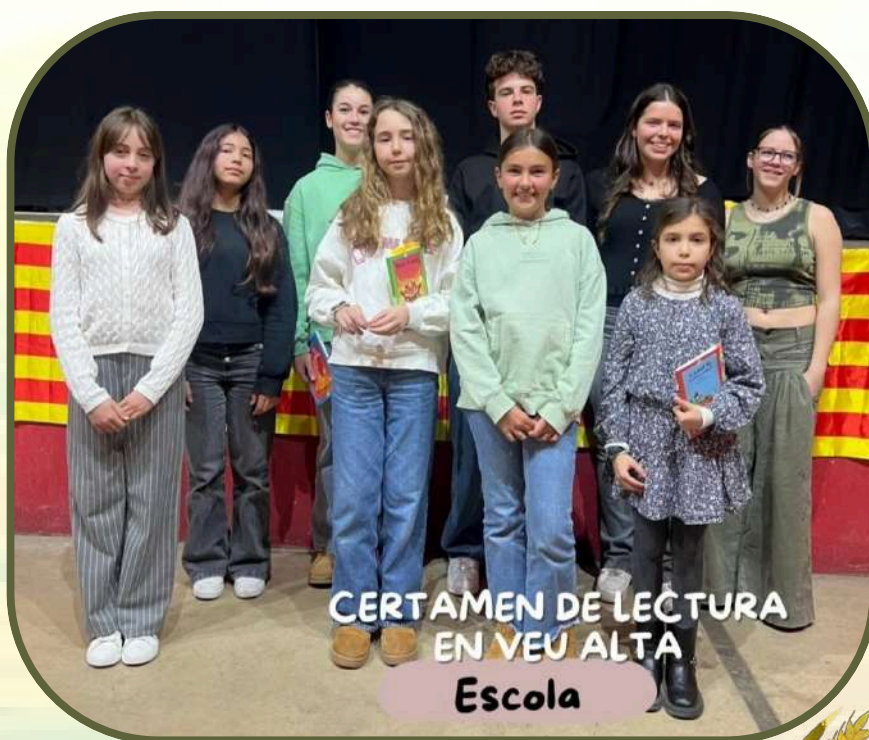
CERTAMEN DE LECTURA EN VEU ALTA Escola