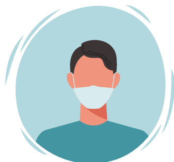
Ús de mascareta