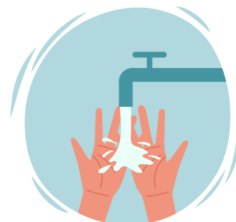
Rentat de mans