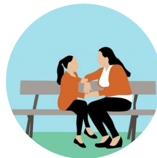
Ús de l'espai exterior