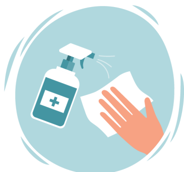
Neteja i desinfecció