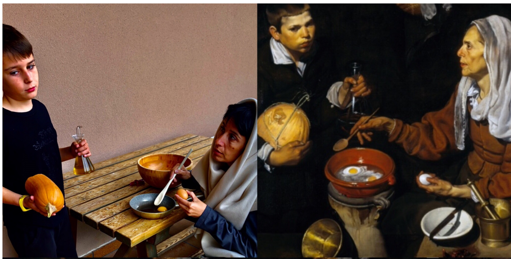
“La vella fregint ous” Velázquez, any 1619.