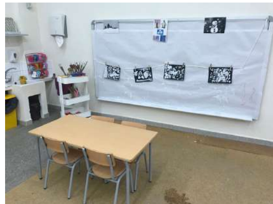
IMATGE 3: Nova aula de P4

El primer dia de posada en marxa el nou espai tots estan emocionats i contents, tant els alumnes, com les famílies i la mestra. I diferents comentaris positius van sorgint, que la mestra va captant, sobretot per part de les famílies: sembla més gran i lluminós, que ben endreçat i organitzat tot, en un espai així també hi treballaria jo, que agradable,... per part dels infants ho volen investigar tot i van mirant tots els racons de la nova aula, alguns comenten que hi falten joguines i d'altres s'adonen que n'han tret però que també n'hi ha de noves. Els agrada molt el racó de lectura i els bancs, de seguida hi van a seure i a mirar nous contes.