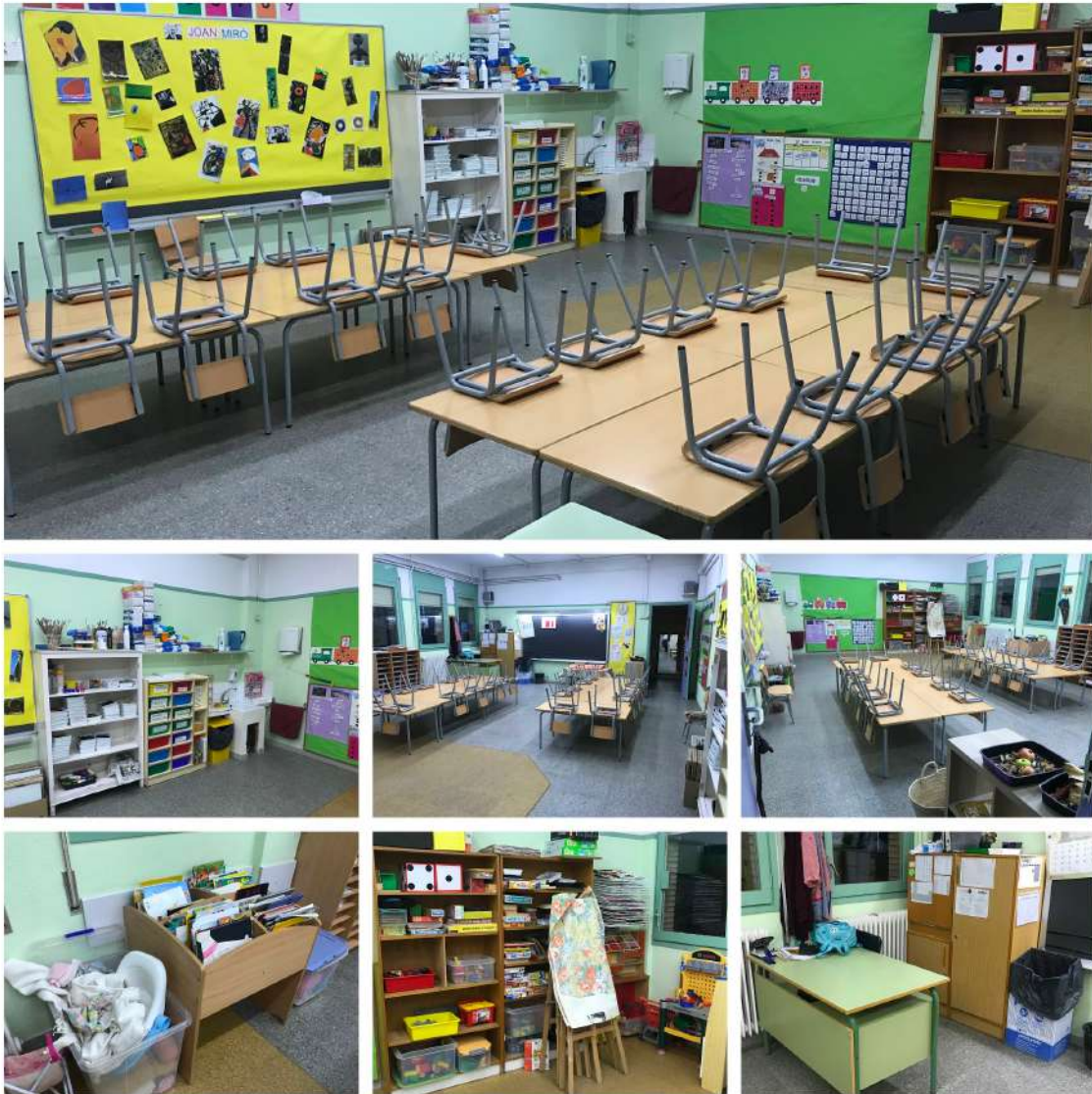
IMATGE 1: aula de P4 abans de la millora

Tenint en compte aquests objectius, vam crear una graella d'observació que, posteriorment també ens ha de servir per valorar el nou espai creat. En aquesta graella es valorava l'espai en interacció amb els alumnes, tenint en compte els criteris següents: autonomia, benestar i estètica, comunicació i socialització, circulació i moviment i material. Intentant crear ítems observables i quantificables per tal que la valoració de l'espai pogués ser el màxim d'objectiva possible.