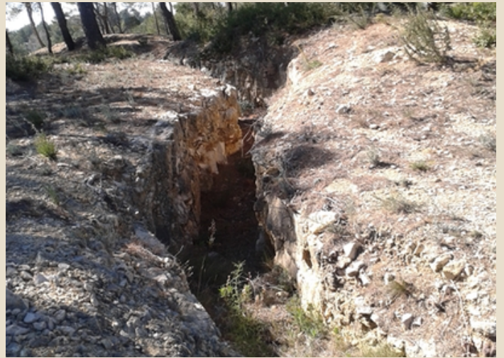
Trinxeres Móra d'Ebre