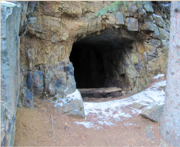
Entrada refugi antiaèri