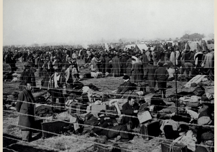
Camp de concentració