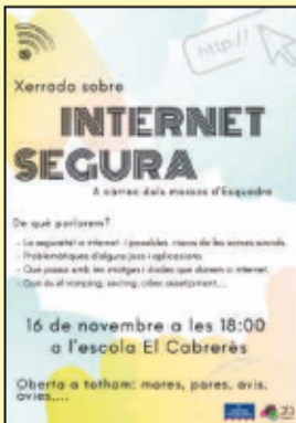
"Internet segura" a càrrec del Mossos d'Esquadra

Al llarg de l'any vam gaudir de varies xerrades ben diverses i interessants: