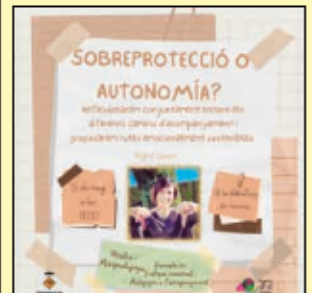
"Sobreprotecció o autonomia" a càrrec d'Ingrid Colom