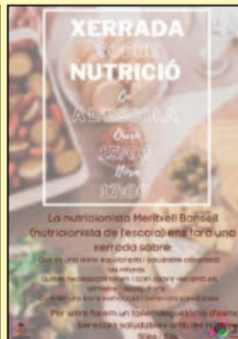
"Taller de nutrició" a càrrec de Meritxell Bansells