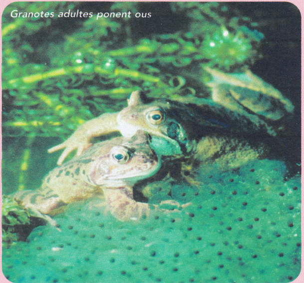
Granotes adultes ponent ous

Dins l'aigua, els amfibis es desplacen nedant . Per terra, les salamandres i els tritons es desplacen reptant i les granotes i els gripaus, saltant . Per poder saltar, les granotes i els gripaus tenen les potes del darrere més desenvolupades que les del davant.