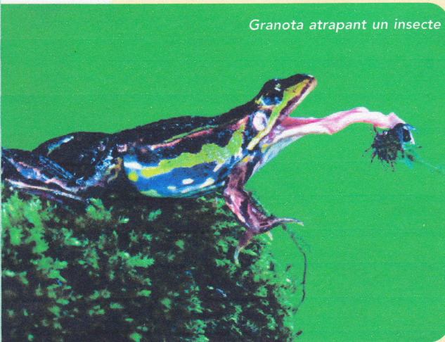
Granota atrapant un insecte

Les larves dels amfibis són herbívores , però els adults són carnívors i generalment mengen insectes o cucs . Els cacen amb la llengua, llarga i enganxosa, els retenen amb unes petites dents que tenen a la boca i se'ls empassen sencers.