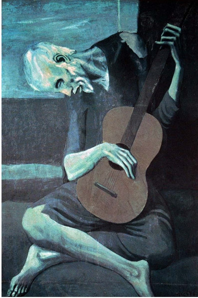
El vell guitarrista cec (1903)