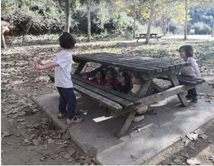
La riquesa del joc simbòlic