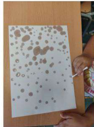
PINTEM AMB OLI