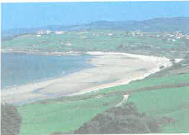
ANGELES DEL RÍO

Un documental devuelve a la actualidad la gran aventura del Pájaro Amarillo, el primer avión europeo que cruzó el Atlántico sin hacer escalas.