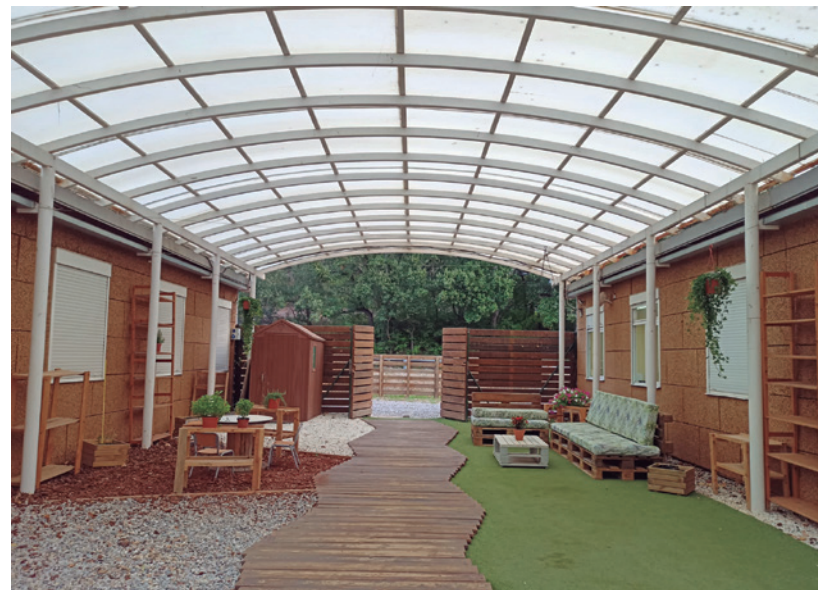
Entrada de l'escola. Un dels espais que volem transformar amb la intenció d'obrir-lo al poble. Escola de Sant Quirze Safaja