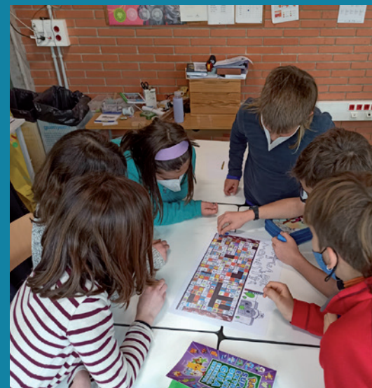
Joc de l'Àliga del monestir