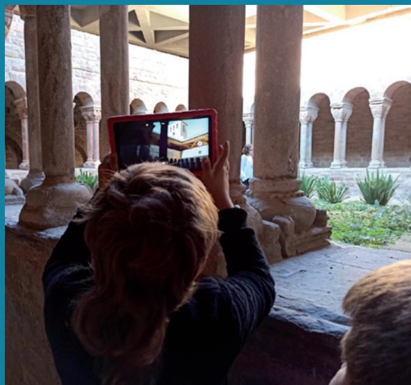
Documentació de l'alumnat per al projecte

Amb els anys també hem après a deixar tot el material editat (revistes, tríptics, jocs...) als arxius municipals dels pobles. És la millor manera que perduri en el temps i ens assegurem que els qui vinguin més endavant en puguin treure profit.