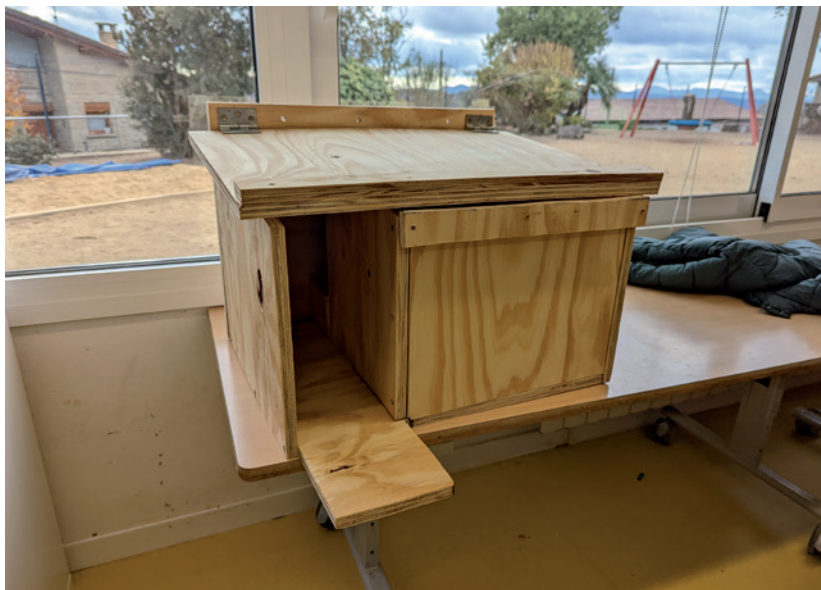
La caixa niu per a les òlibes que vam instal·lar al territori. Escola Els Ventets