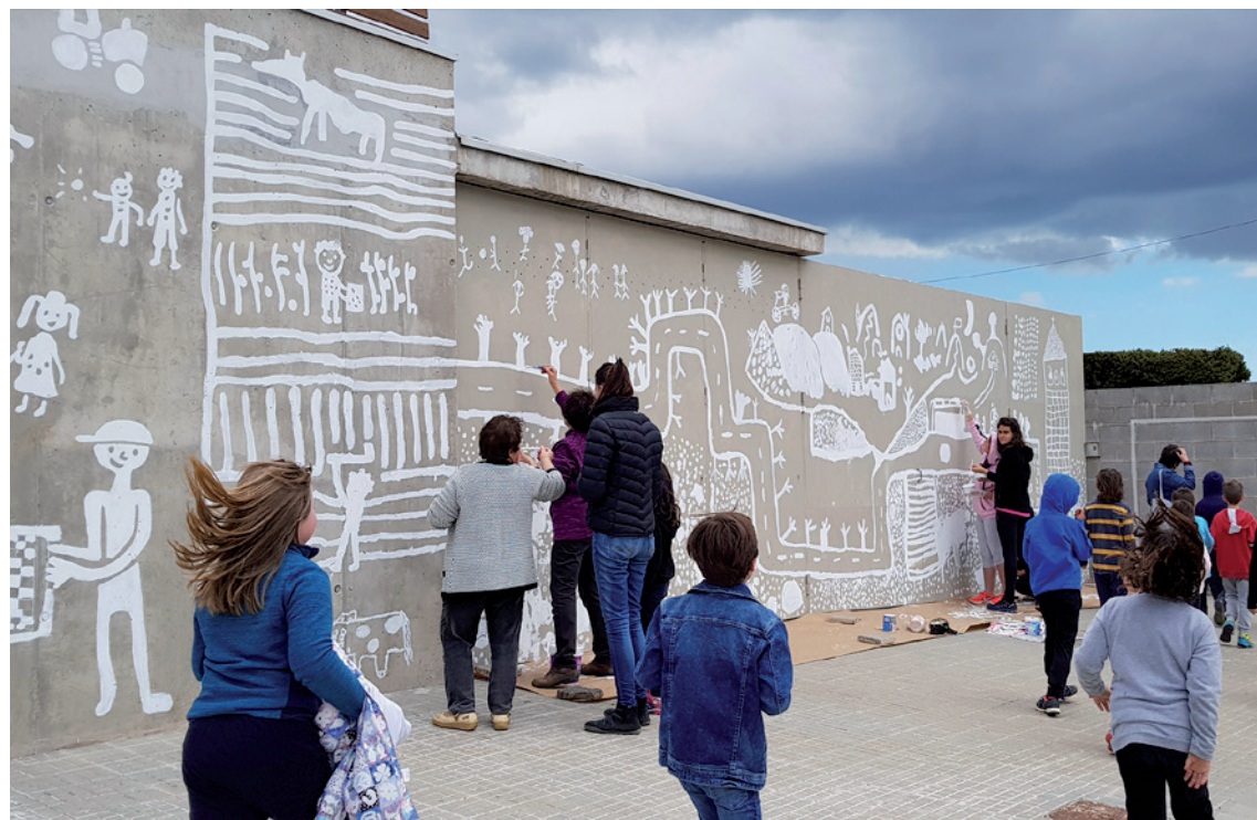
Imatge 1. Mural col·laboratiu a la paret de l'Escola de L'Estanty