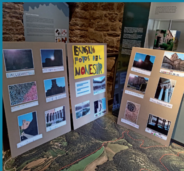
Exposició pública amb les fotos del monestir