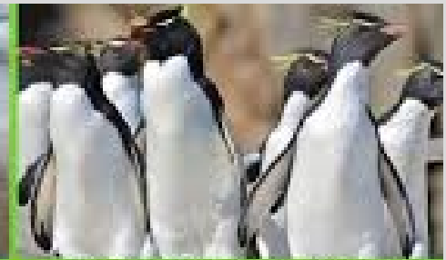
Pinguino de penacho amarillo