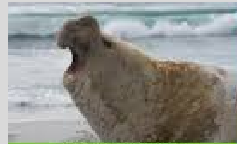
Delfante marino austral