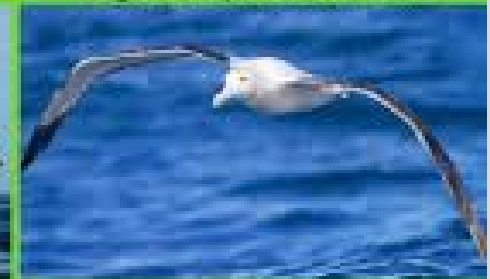
Albatros viajero o errante