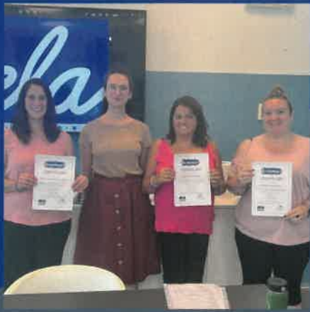
Cursos estructurats a Belonya i Reykjavik