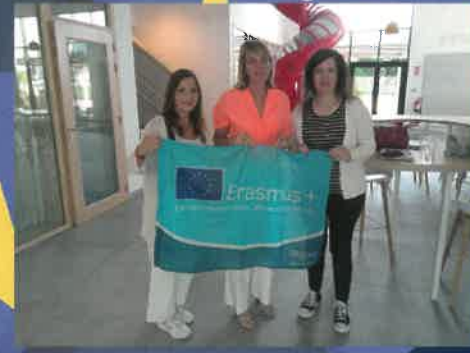
Alumnat de 5è i de 6è ha viatjat a Irlanda i França