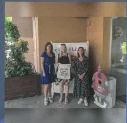
Mestres en pràctiques de la República Txeca i d'Itàlia