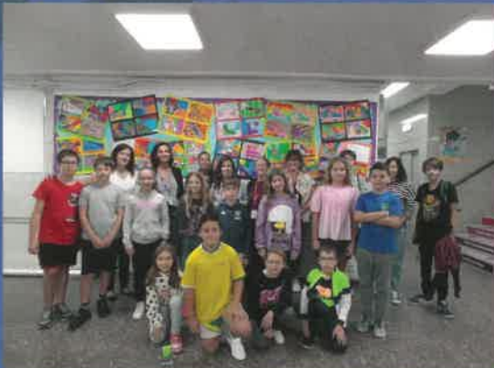
Hem rebut la visita de mestres de França, República Txeca i Bèlgica