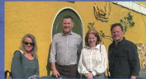
Hem visitat noves escoles a Irlanda i Bèlgica