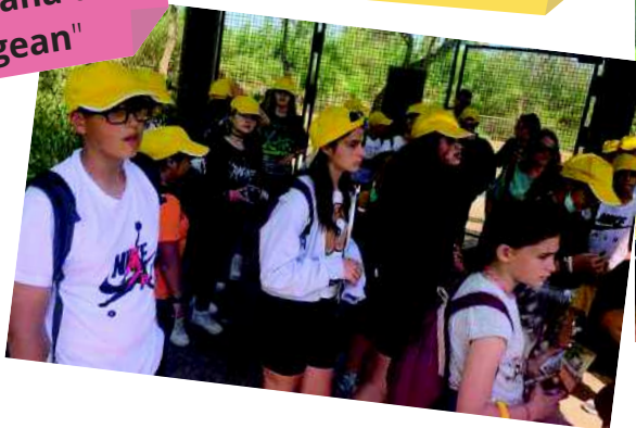
"De tornada vam veure molts animals a la Reserva Africana de Sigean "