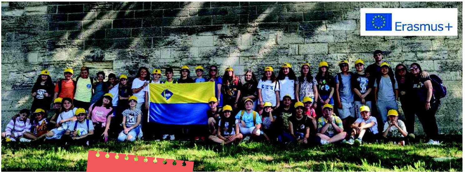
"També vam visitar el Pont d'Avinyó , famós per la cançó i ens vam menjar un gelat"