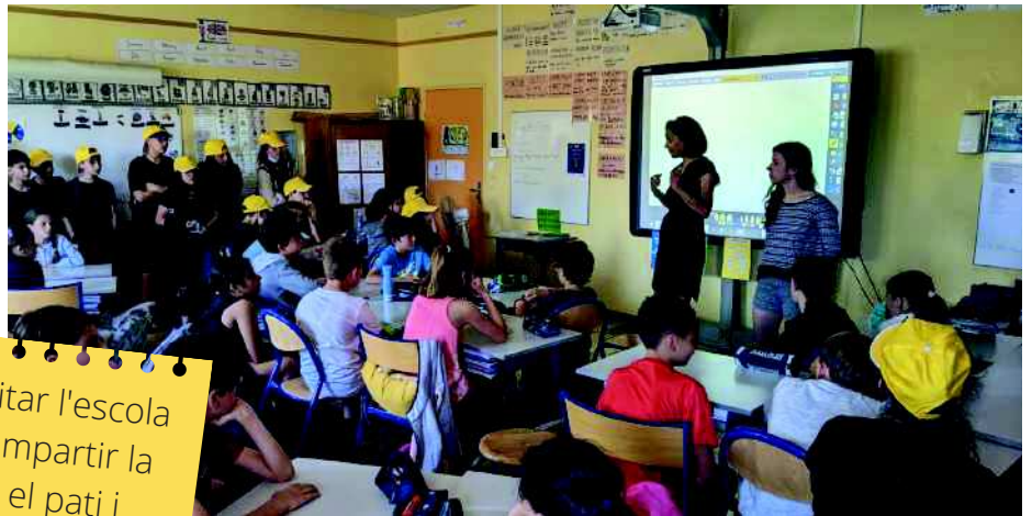
"Vam visitar l'escola i vam compartir la classe, el pati i també el dinar. Després vam anar a la Tour Magne "