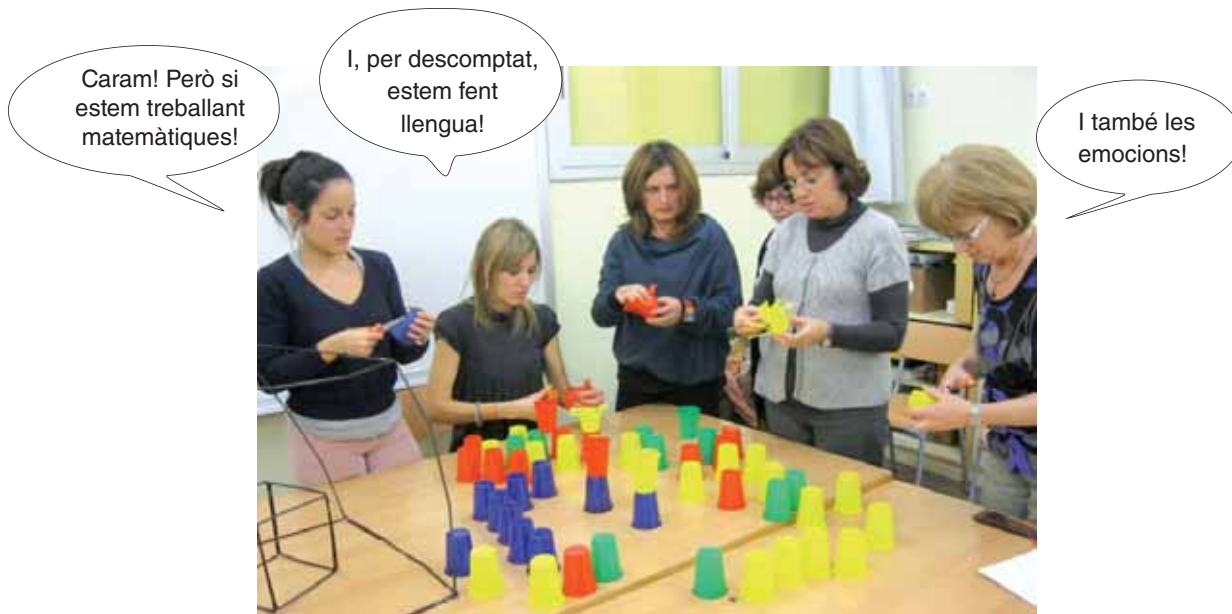
Descobrim el lligam entre el currículum, les competències i l'art