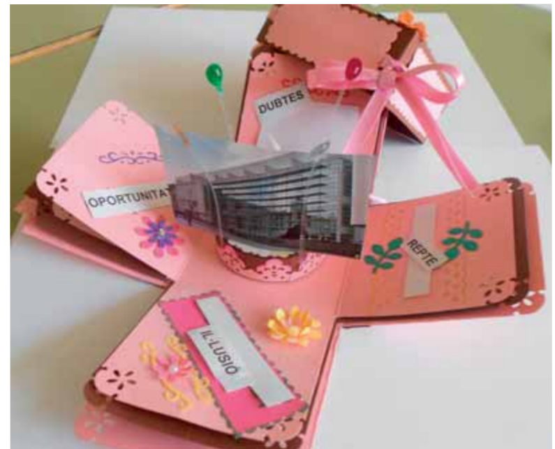
Un regal com a impulsor per al canvi