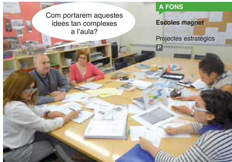
En equip, elaborem el marc teòric del nostre projecte Magnet