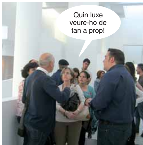
Descobrim el MACBA i el seu equip