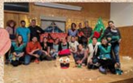
TIC TAC COMPANY