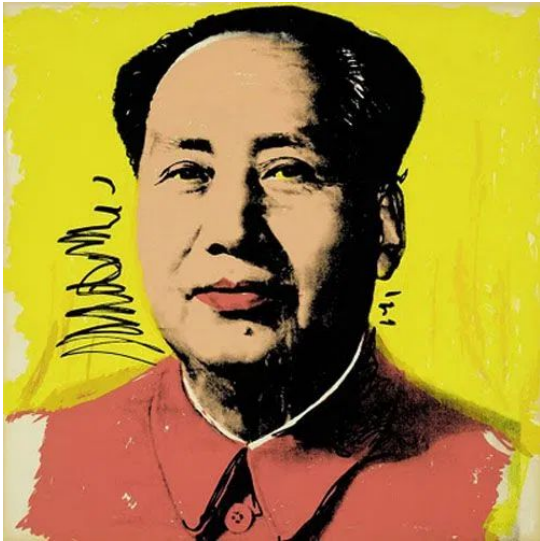
Mao, de Andy Warhol

Esta corriente artística de la etapa modernista realza el valor de la cotidianeidad. De este modo, a través de imágenes y representaciones de objetos populares intenta retratar la realidad del momento.