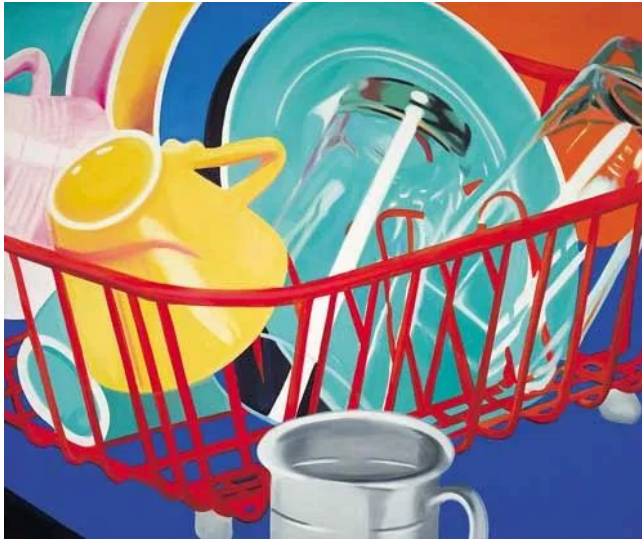
Dishes, de James Rosenquist

Se centra, sobre todo, en imágenes fáciles de identificar y de reconocer, elevándolas hasta la valoración de arte, haciendo de éste algo accesible a toda la sociedad, pues ya no se trata de un universo al que sólo podía accederse acudiendo a los museos.