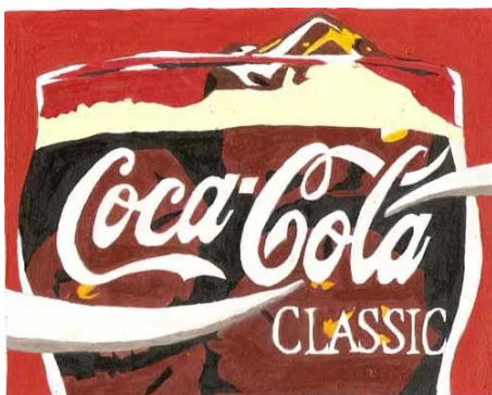
Coca Cola Pop Art, de Klaka97

Aunque cada país alberga unas características propias que diferencia su corriente de Arte Pop de la de otros, lo cierto es que, de una forma o de otra, todas están ligadas a la cultura estadounidense, ya se vista desde dentro o desde fuera.