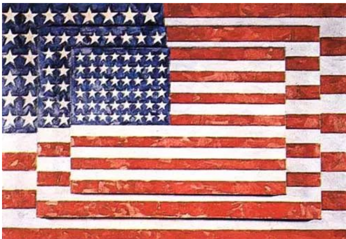
Three Flags, de Jasper Johns

Son las ciudades de Londres y de Nueva York las primeras en tener constancia de esta nueva forma de arte popular. En la primera de ellas, aparece hacia mediados de los años 50 y es a finales de esta época cuando comienza a aflorar en Estados Unidos, lugar desde el que se exporta, años más tarde, a Canadá y Europa.