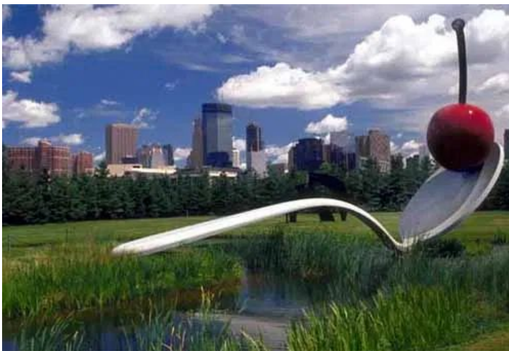
Spoonbridge and Cherry, de Claes

Un presente que caminaba ya hacia un cambio cultural que se desarrollaría en los años posteriores, principalmente en la década de los 60, años en los que el Pop Art alcanza su máximo auge.