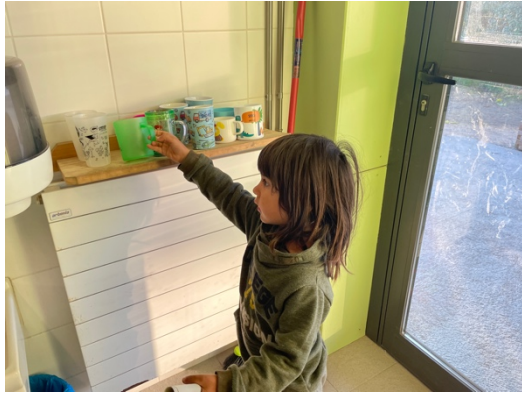
COL·LOQUEM EL GOT AL SEU LLOC I L'ESMORZAR AL CISTELL