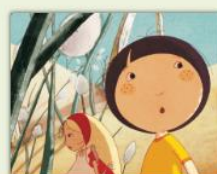
Kerity i la casa dels contes

un nen de 10 anys, i Zarafa, una girafa que el governador d'Egipte regala al rei de França. Maki l'acompanyarà per portar-la de retorn al seu país, tot i les adversitats.