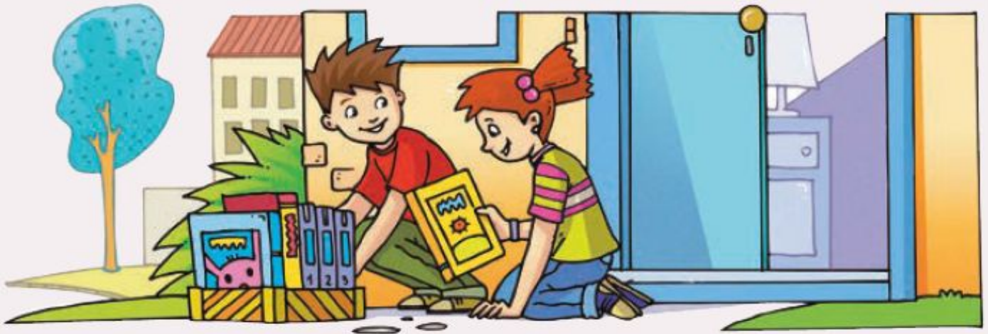
Nens sorpresos davant el seu regal inesperat.

Es desconeix quin ha estat l'origen d'aquest regal tan inesperat, tot i que corren diversos rumors pel poble. El que és segur és que, des d'avui, els riellencs i les riellenques tindran una excusa menys per començar a practicar la lectura, aquest hàbit tan recomanable.