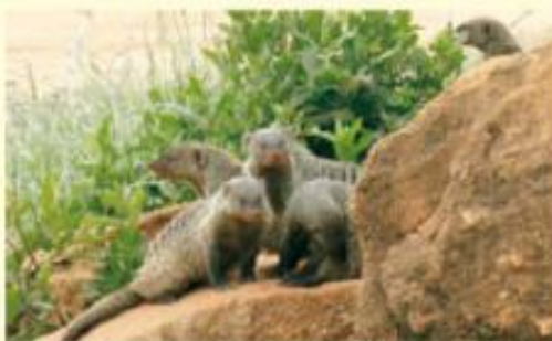
Les mangostes a la seva nova casa.

Les ungles de les extremitats davanteres estan molt més desenvolupades per excavar els caus on es refugia i per furgar 1 el terra i buscar els invertebrats que formen part de la seva alimentació. Sovint fa servir els termiters per construir els caus.