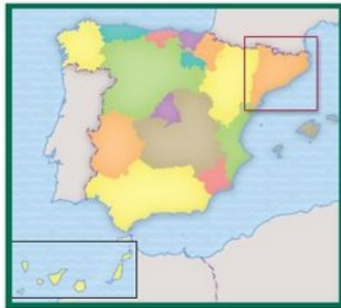
Comunitats autònomes d'Espanya