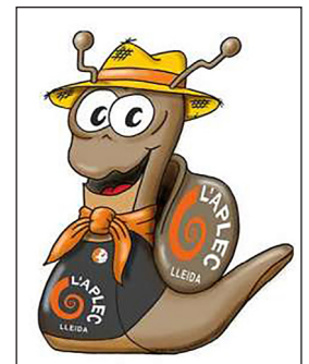
▲ Hèlix, la mascota de l'Aplec

aplec: trobada de persones que celebren una festa.