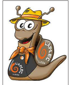
▲ Hélix, la mascota de l'Aplec

aplec: trobada de persones que celebren una festa.