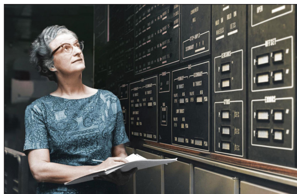
▲ Nancy Roman quan treballava a la NASA

Al conjunt de Lego «Dones de la NASA», una de les dones és Nancy G. Roman, una científica astronoma que va treballar durant molts anys a la NASA. Roman va planificar un telescopi fora de l'atmosfera terrestre que permetés als astrònoms estudiar millor l'espai sense les interferències de la Terra. Així va néixer el telescopi espacial Hubble i, per aquest motiu, la NASA va anomenar Roman com «la mare del Hubble».