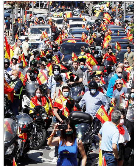
▲ Manifestació en un carrer de Madrid.

De tota manera, hi ha imatges en què es veu que en algunes capitals, com Madrid, Màlaga o Sevilla, no es van respectar les mesures de seguretat. Hi havia persones molt juntes i, en alguns casos, no portaven mascareta. En altres ciutats, on hi ha hagut menys manifestants, sí que s'han complert les normes.