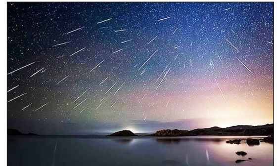
▲ Las Líridas iluminan el cielo de abril

Lo que se conoce como lluvia de estrellas es en realidad el polvo que dejan los meteoritos al acercarse al Sol y desintegrarse. La Tierra pasa a través de esta lluvia de polvo, que se destruye al entrar en la atmósfera terrestre y calentarse. Los destellos de luz que se emiten en ese proceso es lo que el ojo humano puede percibir y se consideran estrellas fugaces.