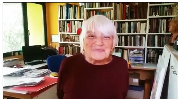
▲ Pilarín Bayés presenta el premi d'aquest any des del seu estudi https://bit.ly/2ySkQg0

MOLTÍSSIMS NENS I NENES DE PRIMÀRIA HAN ESCRIT CONTES PER PARTICIPAR EN EL PREMI PILARÍN BAYÉS 2020. PILARÍN BAYÉS ÉS UNA IL·LUSTRADORA DE VIC QUE HA DIBUIXAT PER A MOLTS CONTES INFANTILS. L'EDITORIAL MEDITERRÀNIA I L'OBRA SOCIAL SANT JOAN DE DÉU VAN PENSAR EN ELLA PER A AQUESTS PREMIS, PERQUÈ ESTIMA ELS CONTES, ESTIMA ELS INFANTS I TREBALLA ELS VALORS.