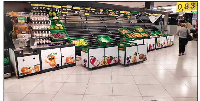
▲ Un establecimiento de Mercadona en los primeros días del estado de alarma

¿Por qué se ha agotado el papel higiénico en muchos supermercados? ¿Qué es el efecto de bola de nieve? | ¿Crees que es sensato abastecerse copiosamente?