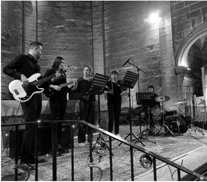
EMM Combo - Flowers - Concert de Nadal.