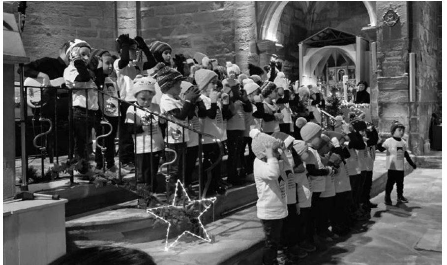
EMM Sensibilització - El ninot de neu - Concert de Nadal.

Per segon any consecutiu vam sortir de l'escola per barrejar diferents generacions amb la voluntat de seguir cultivant el cançoner popular català. Dimecres 20 de desembre