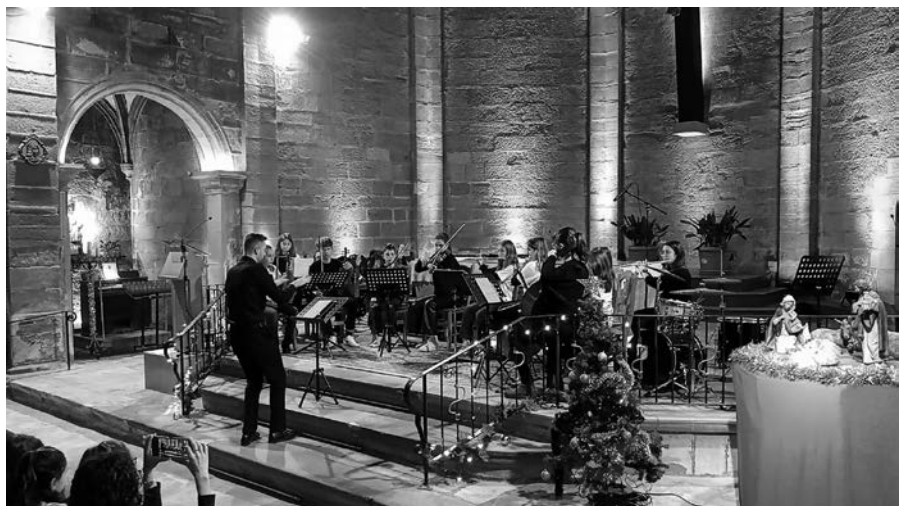
Conjunt Orquestral - Viva la vida - Concert de Nadal.