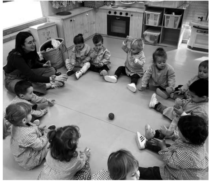
EMM Música a la Llar d'infants.

al vespre vam poder sentir diverses nades tradicionals catalanes a càrrec de l'alumnat i la Coral Flor de Lli. Va ser una tarda musical dis-tesa i diferent amb família!