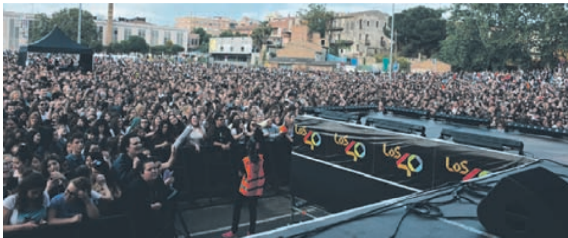
L'Escardívol es va omplir de gom a gom durant el festival de Los 40.

Segons Aguilar, aquesta dotzena edició del festival "és l'enveja de la resta de festivals del país" gràcies al directe de cançons que seran l'èxit