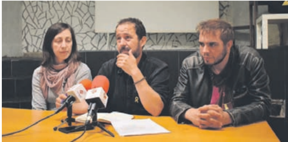
Els tres regidors de l'AUP, durant la roda de premsa.

Així, l'informe suggeria, entre altres, que s'apartés del càrrec el responsable mentre es formava per