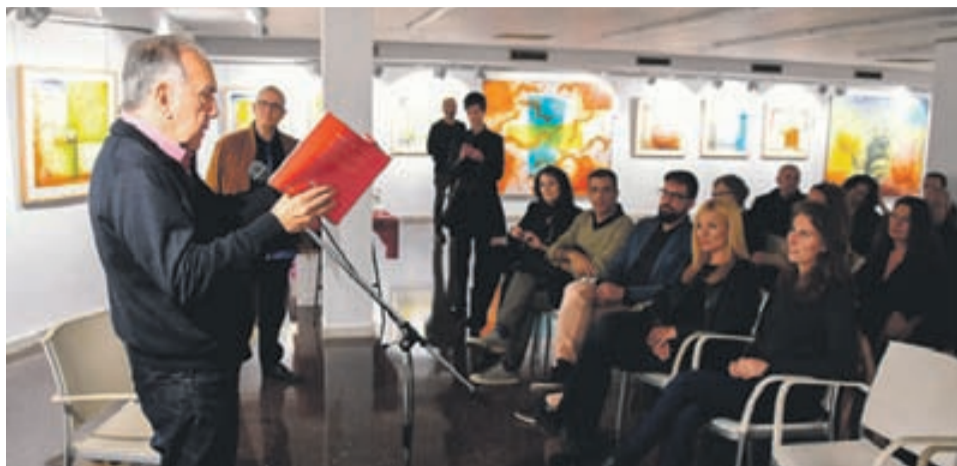
El poeta va recitar alguns dels seus poemes, font d'inspiració dels quadres de Marcos.