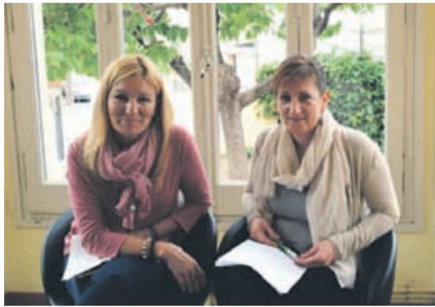
L'alcaldesa de Rubí, acompanyada per la regidora de Joventut.

El document s'estructura en cinc eixos: salut i esports; cultura, oci i creativitat; emancipació –que engloba educació, ocupació