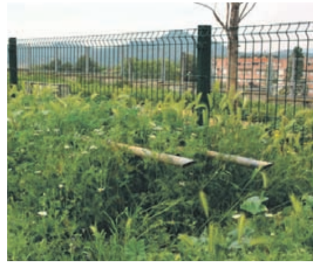
A la part exterior de la zona d'esbarjo per a gossos, hi ha dos ferros abandonats.

A banda del poc manteniment d'aquesta zona, els usuaris també han detectat elements que poden resultar molt perillosos. Per exemple, la tanca que separa la zona d'esbarjo per a gossos amb les vies del tren està trencada, fet