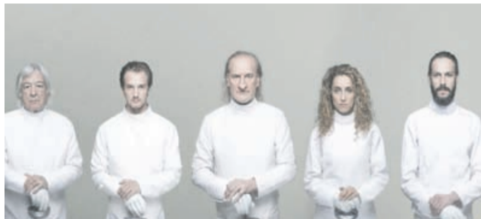
Al centre, Lluís Homar, que interpreta una nova versió de 'Cyrano'.

Les entrades ja es poden adquirir a través de la web www.casalpopular.org i també una hora abans de cada representació.