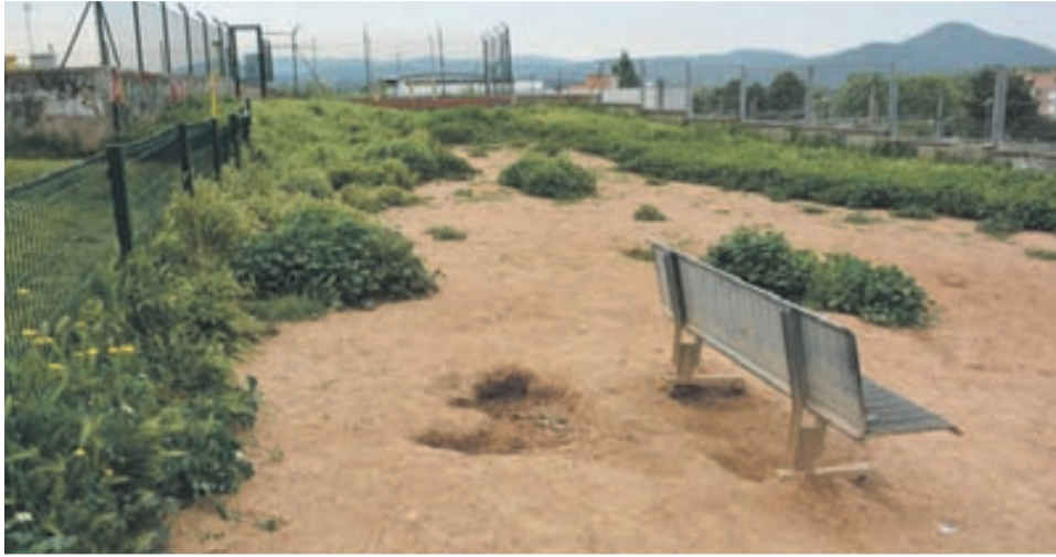
Forats, herbes altes i olors fètidés són algunes de les queixes dels usuaris de la zona.

Els usuaris lamenten que un any després de les denúncies per mal manteniment, la zona segueixi en males condicions