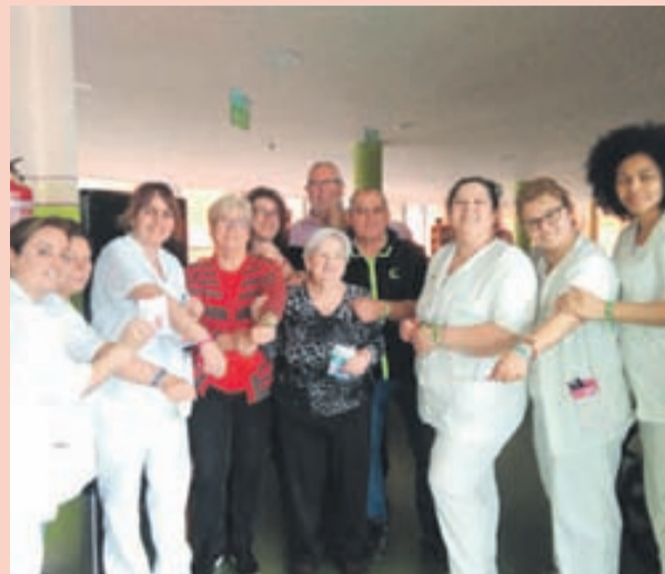
Usuaris i treballadores de la residència, mostrant les polseres solidàries 'Salvavides'.