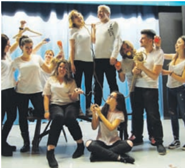
Actors i actrius del Grup Escènic del Casal Popular, que posarà en escena aquest muntatge en clau de comèdia.