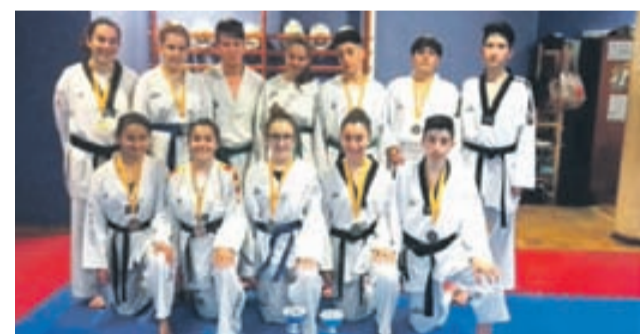
Participants del Balmes en el Campionat de Catalunya.