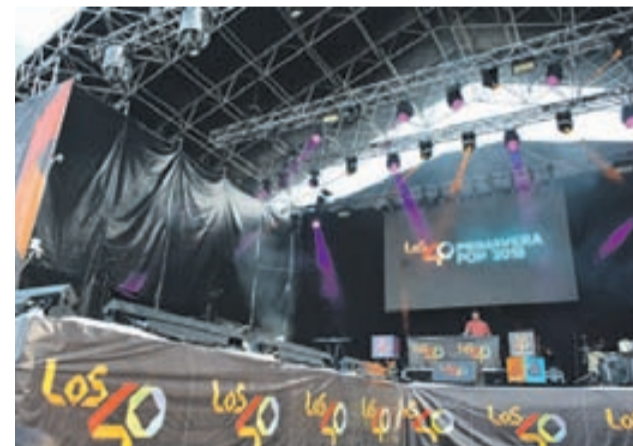
Un dels moments del festival, que va tenir lloc dissabte a la tarda a l'Escardívol.

"Abans de renovar el contracte necessitem comptar amb tots els elements, els positius i els negatius, per saber si compensa i de-