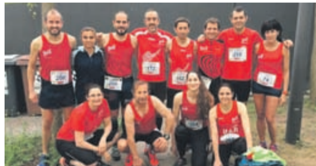
Els atletes de la UAR també van assolir bons resultats a la prova rubinenca.