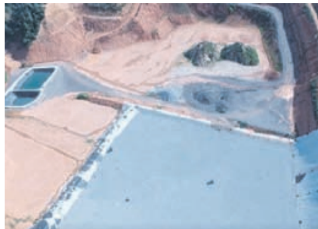
La plataforma exigeix que només s'aboquin 1 milió de m 3 de residus, que és el que recull la sentència dels anys 90.

Per aquest motiu, demanen que no es concedeixi permís per abocar residus de classe 2, sinó únicament terres i runes i els tipus de resi-