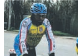
Ciclista del CCR.

El Club Ciclista Rubí organitza dues noves sortides pel diumenge 13 de maig. El grup A farà un recorregut de 140 km amb sortida des de la plaça Doctor Guardiet a les 7 hores. L'itinerari serà Rubí, Terrassa, Rellinars, Castellbell, Marganell, Sant Salvador de Guardiola i Òdena. La tornada serà per la Pobla de Claromunt, Capellades, Sant Quintí de Mediona, Sant Sadurní, Martorell, La Xararra i Rubí de nou.