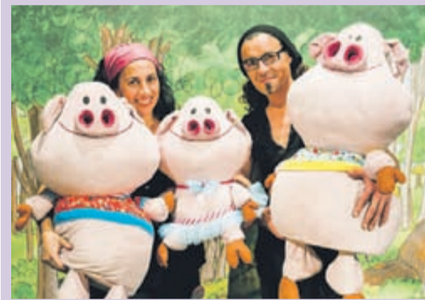
La companyia Samfaina de colors és qui posa en escena l'espectacle. / Cedida

La funció serà a les 12 hores i el preu de l'entrada és de 5 euros pels socis i 6 pels no socis. / DdR