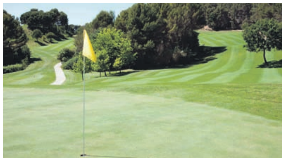
Els terrenys del camp de golf de Can Sant Joan són propietat de l'INCASÒL.

El camp de golf de Can Sant Joan va obrir el 1994, dissenyat pel golfista Severiano Ballesteros, com el primer camp públic de Catalunya i va estar impulsat