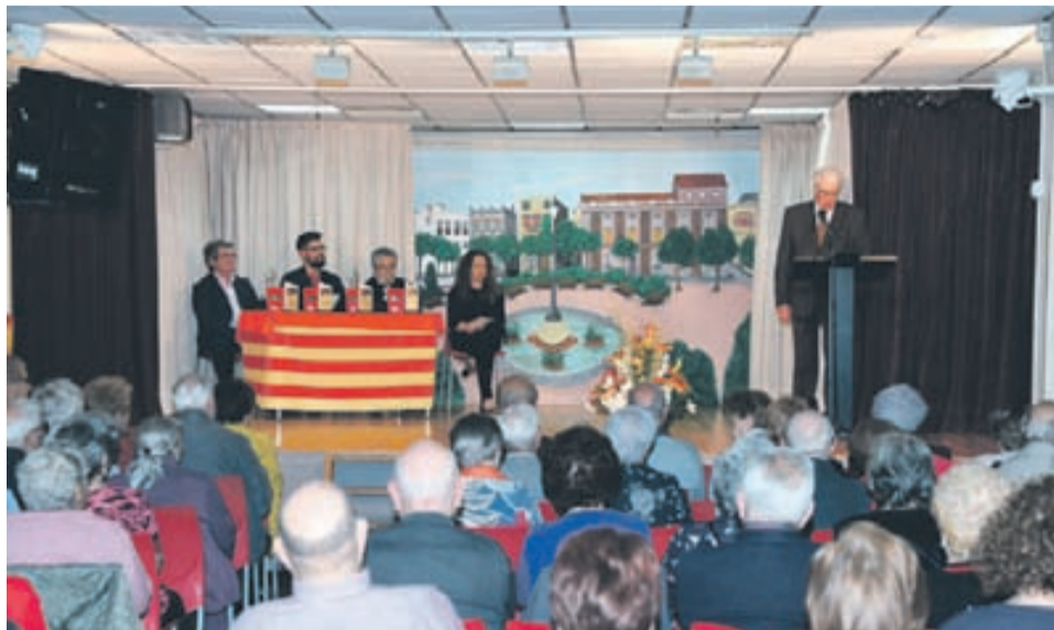
Un moment del lliurament dels premis.

"Estem molt orgullosos d'acompanyar la gent gran