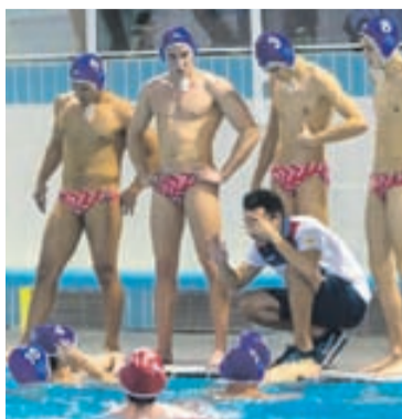
Jugadors del Masculí B.

Ara, l'equip es desplaçarà aquest divendres a Alcobendas, a Madrid, per disputar la fase d'ascens a la Segona Divisió Nacional. La competició tindrà lloc