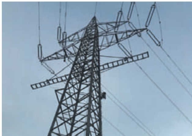
Els republicans tornen a portar al Congrés el soterrament de les línies d'alta tensió a Rubí.

D'altra banda, la formació republicana ha presentat esmenes per demanar l'adequació de l'entorn de