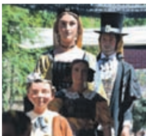
Els Gegants de Rubí.

amb el Gran Premi de Fórmula 1 que es disputa al Circuit