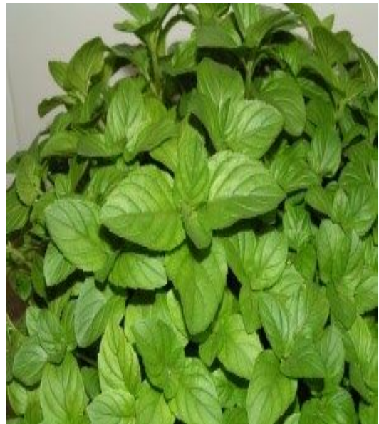
MENTA (per infusió i begudes)