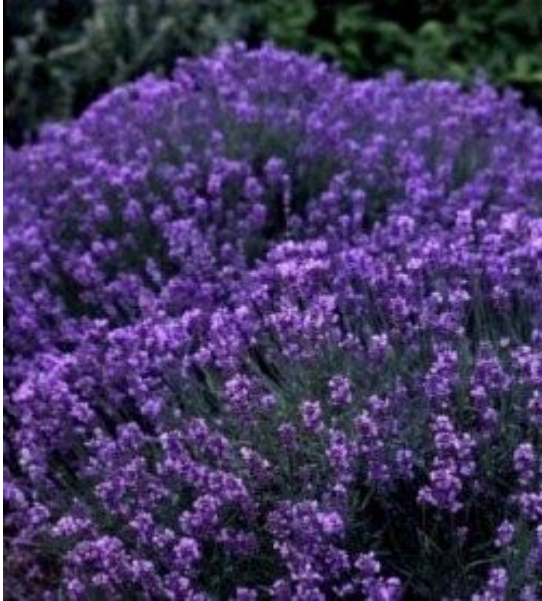
ESPÍGOL (per fer colònia i essències)