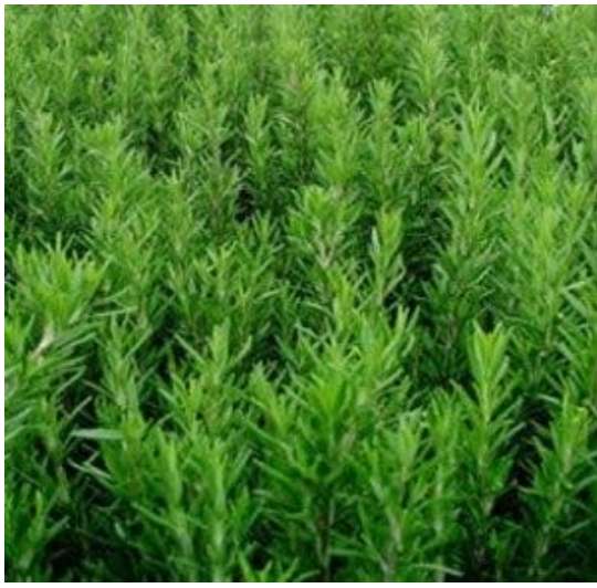
ROMANÍ( cuinar i olis curatius)