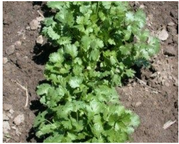
CORIANDRE (cuinar i amanides)