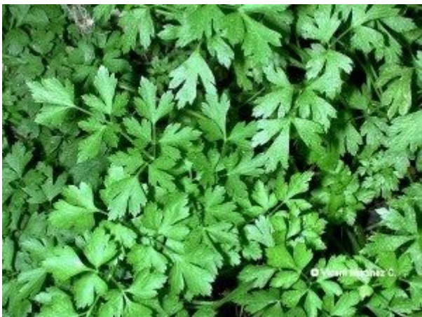
JULIVERT (per posar al menjar)