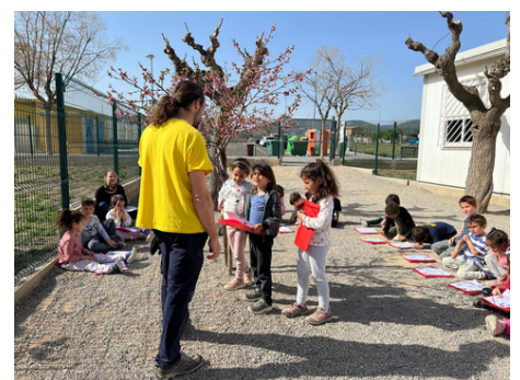
NIL, IDAIRA I AITANA