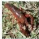
CRANC DE RIU AMERICÀ