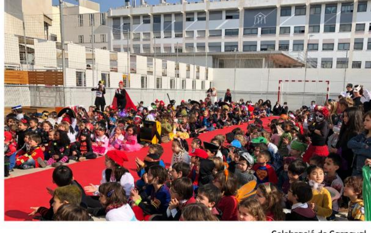
Celebració de Carnaval