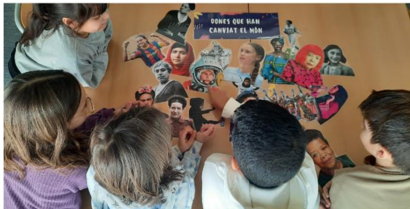
Activitat del dia de les dones