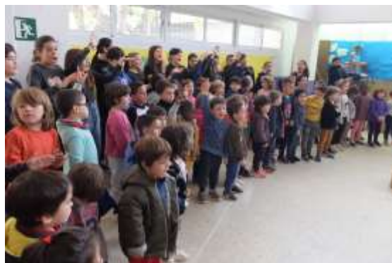
Concert al teatre de l'Amistat: