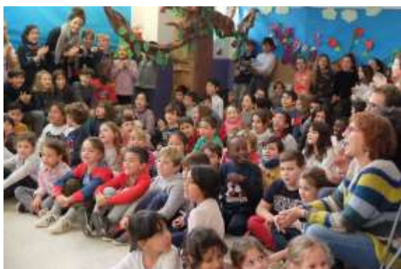
Concert a l'escola: